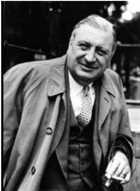
Anton van Duinkerken (1903-1968)